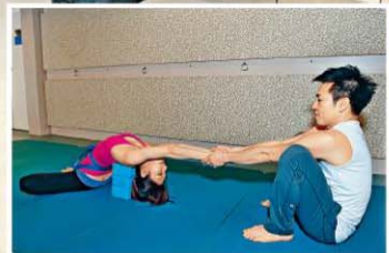
「蝴蝶提升式」三步曲中，患者在瑜珈導師的幫助下拉壓筋骨，增加血液流動，舒緩痛症。