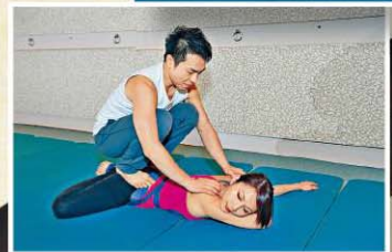
「標槍式」是二人合作的瑜珈動作，雙腿放置平衡並不容易。