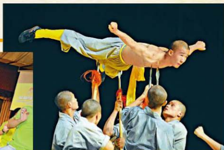
氣功有軟有硬。少林武僧所練的就是硬氣功的一種。